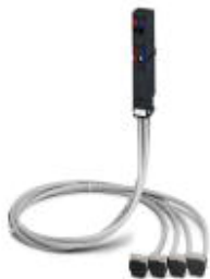
Adapter czołowy VIP-VARIOFACE z przyłączonymi kablami systemowymi do SMATIC S7-300, podłączenie 4 x 8 kanałów, Długość kabla: 2,5 m

Należy pamiętać, że podane dane pochodzą z katalogu online. Proszę o pobranie kompletnych informacji i danych z dokumentacji użytkownika. Obowiązują ogólne warunki użytkowania dla materiałów pobieranych przez Internet. ( http://phoenixcontact.pl/download )